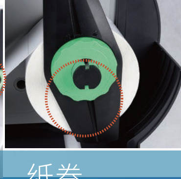
显示屏、传感器、碳带、纸卷