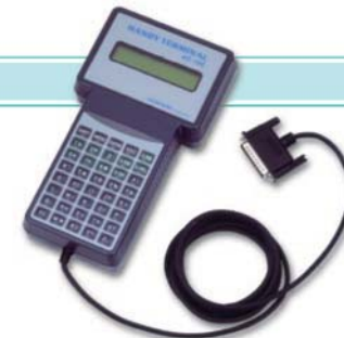
便携式终端 (选购附件)

根据从设定喷印条件的个人电脑或便携式终端输入的喷印数据，控制喷印机头和油漆·清洗剂泵柜。