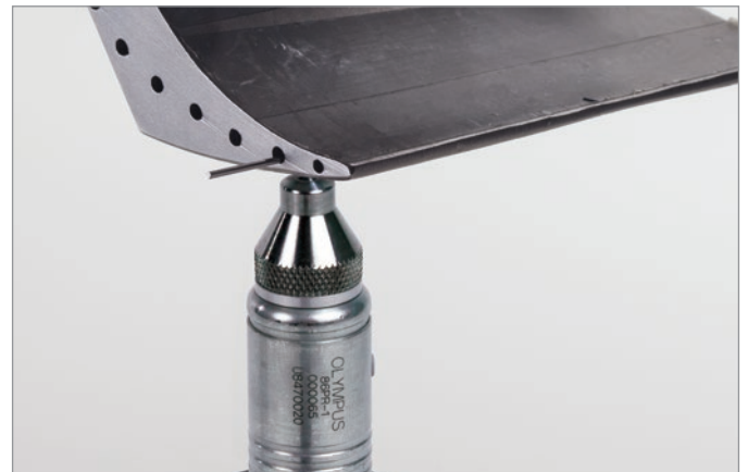
使用目标钢线对涡轮叶片进行测量