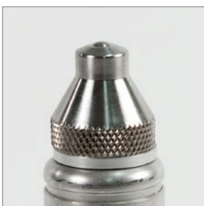
可拆卸标准防磨帽 86PR1-WC