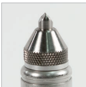
可拆卸尖型防磨帽 86PR1-CWC