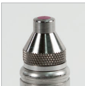
可拆卸加强防磨帽 86PR1-EWC