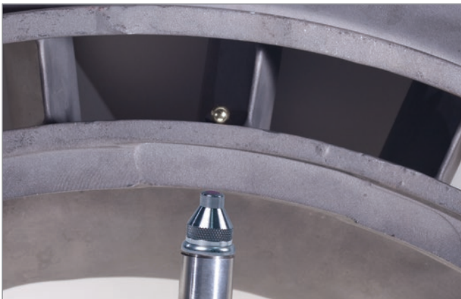
对24.1毫米的航天器铸件进行测量

Magna-Mike已被成功地应用于航空航天领域的质量控制程序中，对由复合材料及非铁性材料制成的航空航天器的各个部件进行测量。目标钢线可被插入到涡轮叶片的冷却孔中，而较大的磁性目标钢珠可用于测量厚达25.4毫米的喷气式引擎部件。