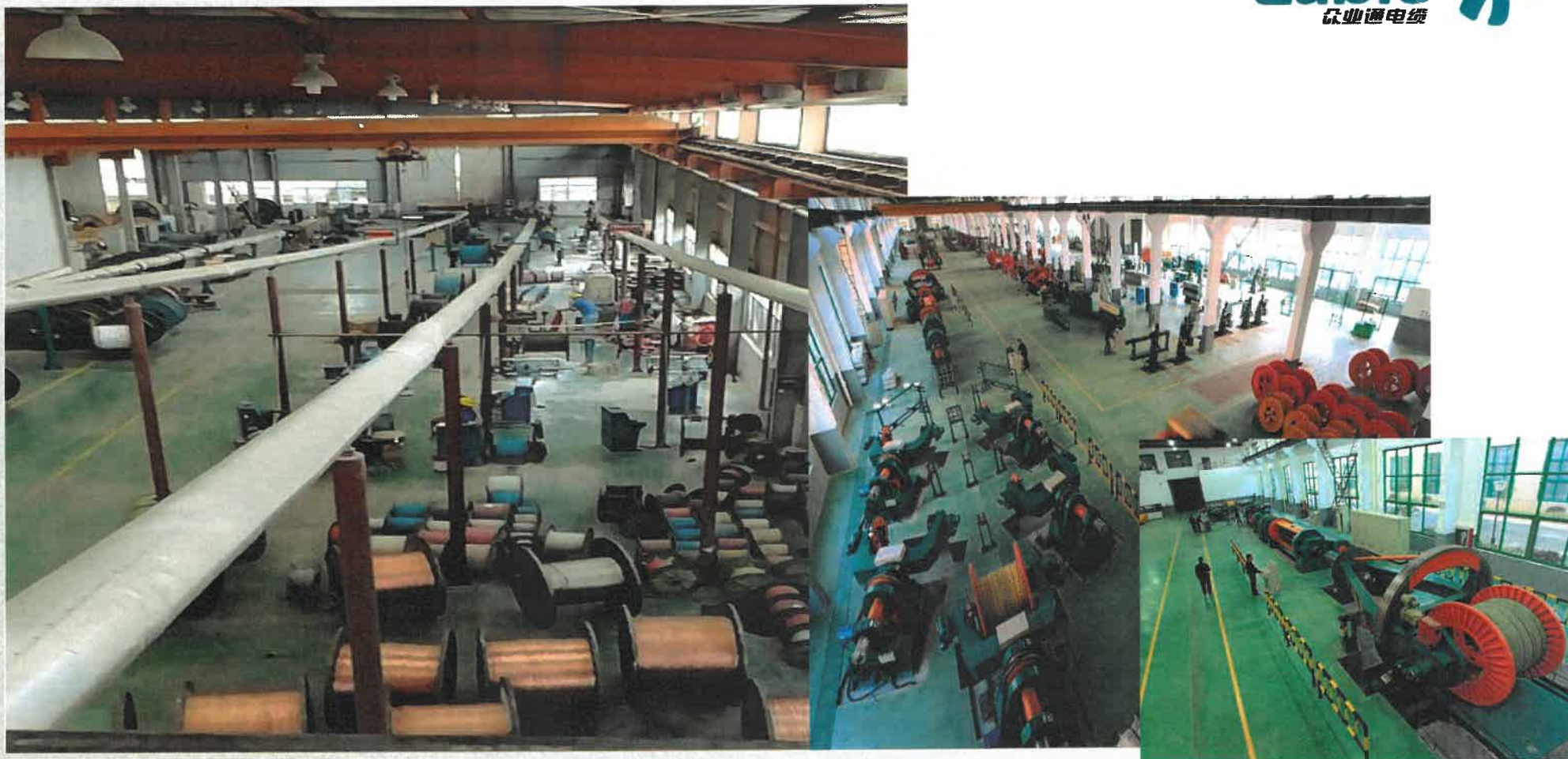
众业通宁波 B1级DC 1500V 直流电缆生产车间