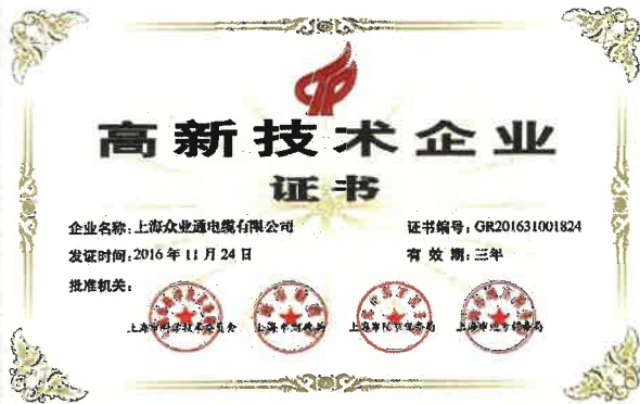
高新技术企业认定证书