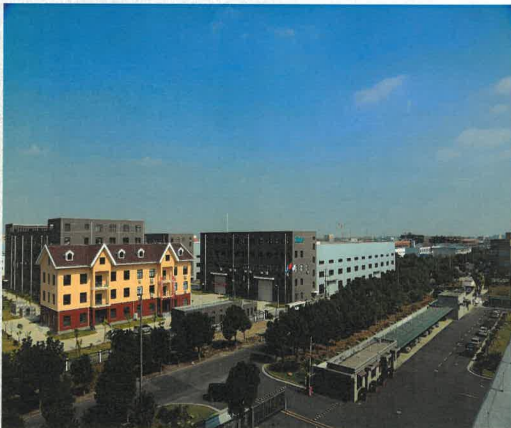
众业通电缆上海生产基地