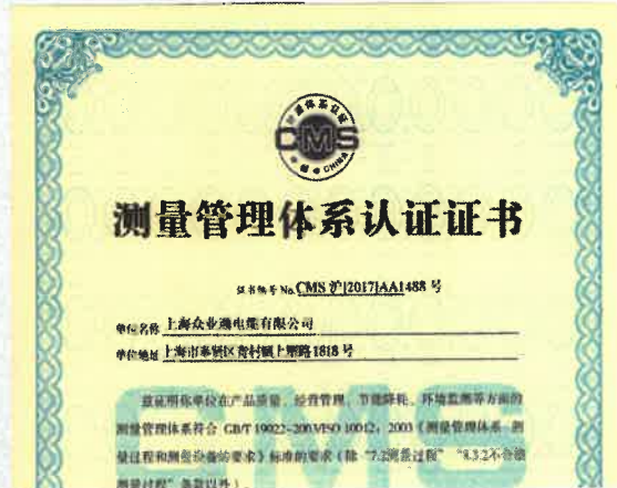
测量管理体系认证