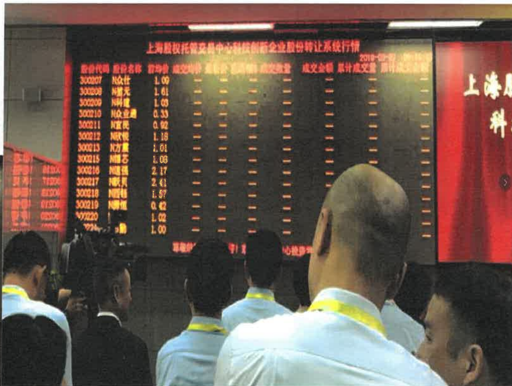
公司股票集合竞价