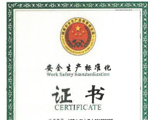
安全生产标准化证书