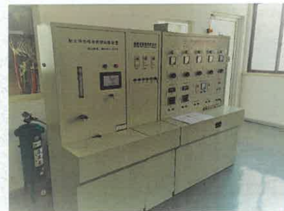
产品燃烧试验装置