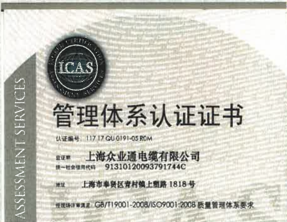
质量管理体系认证